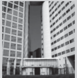
Нидерландын Гаага дахь Олон Улсын Зүүгийн Шүүх

Олон улсын шүүхэд эх сурвалж, баримтыг өгөх, хуучин Югослав дах мөргөлдөөний үеэрх гэмт хэргийн бүх хохирогчдын эрх ашгийг хамгаалахад хангалттай цаг хугацаа олгохыг Эмнести Интернэшнл НҮБ-д хандан уриаллаа. Ялангуяа 2010 онд дуусгасан байх хугацаа нь Ратко Младик, Горан Нажичийн дайны хэргийг авч үзэхэд хэт богино хугацаа билээ.