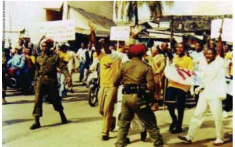
Аюулгүйн албаныхан 2008 оны 2 дугаар сард болсон жагсаалыг хүч хэрэглэн тарааж буй нь. Амьдралын өртөг нэмэгдэж, цалин бага байгааг эсэргүүцсэн жагсагчдаас 100 гаруй хүн амьсгаа алджээ.