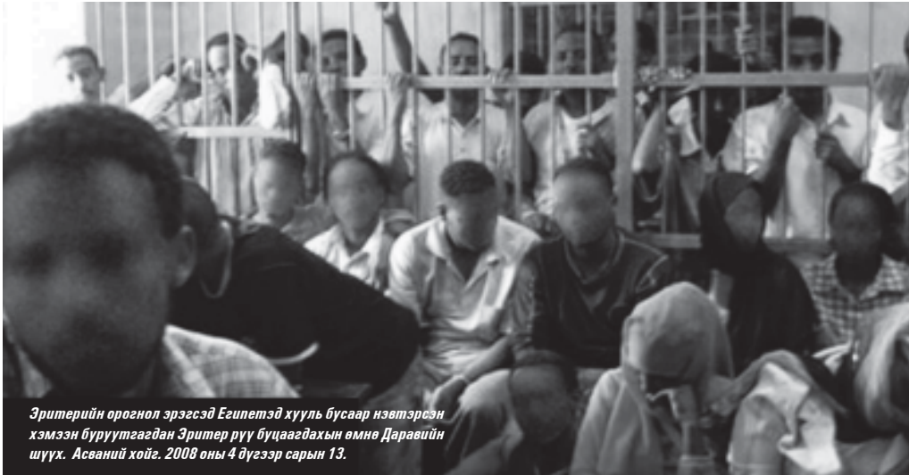
Эритерийн орогнол эрэгсэд Египетэд хууль бусаар нэвтэрсэн хэмээн буруутгагдан Эритер рүү буцаагдахын өмнө Даравийн шүүх. Асвааний хойг, 2008 оны 4 дүгээр сарын 13.

Египет, Ливид хоригдож буй орогнол эрэгсэд Эритер рүү буцаагдах айдсын дор төдийгүй эрүү шүүлт, хүний эрхийн ноцтой зөрчилд өртөж байж болзошгүй байна.