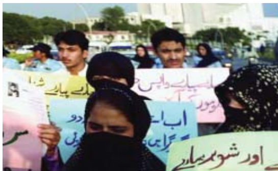
2006 оны 9 дүгээр сар, Пакистаны дээд шүүхийн өмнө сураггүй алга болгох явдлыг эсэргүүцсэн жагсаал болж буй нь

2008 оны 8 дугаар сарын сонгуулийн дараа шинэ эвслийн засгийн газар байгуулагдсан байна. Пакистаны энэ шинэ засгийн газраас сураггүй алга болгох хэргийг шалгах, гэм буруутай этгээдүүдэд хариуцлага тооцохыг Эмнести Интернэшнл уриалж байгаа юм. Шинэ засгийн газар шүүгчдийг эргэн томилж, сураггүй алга бологсдын хэргийг шийдвэрлэн, хохирогчдыг цагаатгах ёстой.