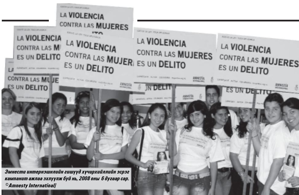
Эмнести интернэшнлийн гишүүд хүчирхийллийн эсрэг кампанит ажлаа эхлүүлж буй нь, 2008 оны 6 дугаар сар.