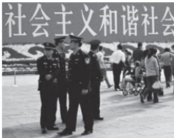
2005 оны 10 дугаар сарын 5-нд Хятадын үндэсний өдөр Тянь-Ань-Миний талбайг хамгаалж буй цагдаа нар

Хэдийгээр нилээд хүн суллардаад байгаа боловч 1989 онд ардчиллын төлөө Тянь-Ань Миний талбай дээр жагссанаас хойш 18 жил болсон боловч олон арван хүн хоригдсон хэвээр байна. Хятадын засгийн газар 1989 оны 6 дугаар сарын 4-нд Аюулгүйн хүчний цэргүүд Тянь-Ань Миний талбай дээр хэдэн зуун хүн алж, шархдуулсан хэрэгт бүрэн дүүрэн, бие даасан хараат бус мөрдөн шалгалт хийхээс татгалзсан хэвээр байна. 2007 оны 6 дугаар сард хайртай нэгнээ эргэн дурсахыг зөвшөөрөх зэргээр албан ёсны зарим хязгаарлалтыг зөөлрүүлсэн ч гэлээ, хохирогчдын гэр бүлийнхэн болон бусдыг шударга ёсыг шаардсан кампанит ажил явуулахыг нь хязгаарлаж, цагдаагийн хяналт тавих, айлган сүрдүүлэх явдал байсаар байна. 1989 оны 6 дугаар сарын хэрэг явдлын талаархи хэвлэл мэдээлэл сонин, цахим нээлттэй хэлэлцүүлгийг цагдан хянасаар л байна.