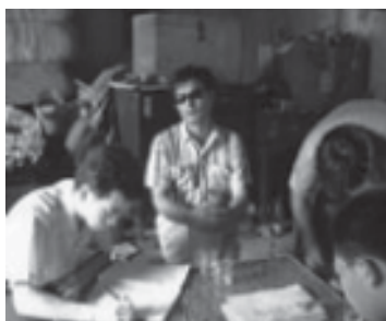
Чен Гуанченг Линей тосгоны иргэдтэй ярилцаж буй нь, Шандон аймаг.

Чен Гуанченг үсээ хусуулахаас татгалзсаныхаа улмаас 2007 оны 6 дугаар сарын 16-нд хорихын хянагчийн тушаалаар бусад хоригдлуудад зодуулсан байна. Эмнести Интернэшнл түүнийг хүний эрхийг хамгаалах үйл ажиллагаа явуулсныхаа улмаас баривчлагдсан үзэл санааны хоригдол гэж үзэж байгаа бөгөөд нэн даруй, ямар ч болзолгүйгээр суллахыг шаардаж байна.