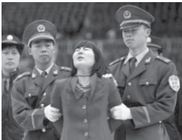
Хүн алсан гэмт хэрэгт буруутгагдаад буй эмэгтэй 2001 оны 4 дүгээр сарын 11-нд Хятадын Гуанжоу хотод цаазлагдахаар явж буй нь.

Хүний нэр төрийг хадгалах Олимпийн гол зарчмын дагуу Хятад цаазаар авах ялын гүйцэтгэлийг зогсоох нь эерэг үлгэр дууриал болон үлдэх билээ. Цаазаар авах ялыг халах анхны алхам болгож, Хятад улс цаазлагдсан хүмүүсийн бодит тоог мэдээлэх, болон цаазаар авах ял оноож буй гэмт хэргийн тоог бууруулах ёстой.