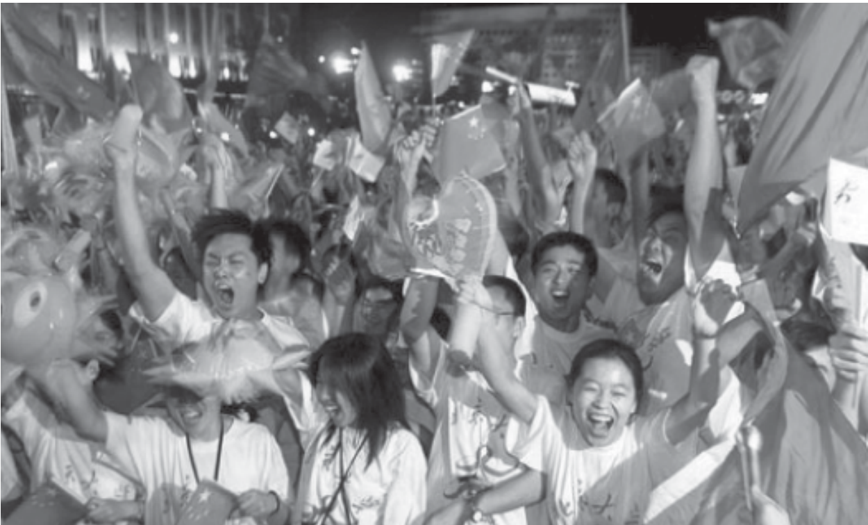
2008 онд Олимпын эрх авсаныг зарласны дараа Бээжин хотод баярлан тэмдэглэж буй байдал