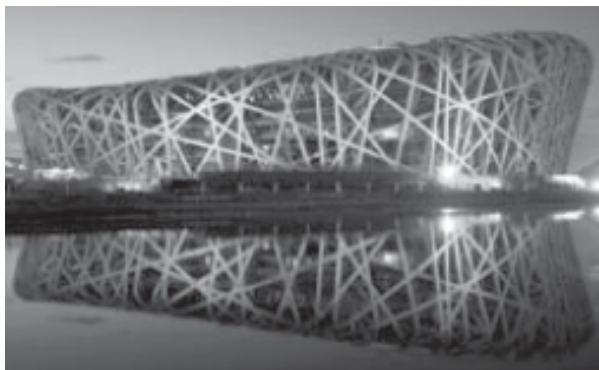
Бээжингийн Төв Цэнгэлдэх Хүрээлэн

Олимпийн тоглолт нь нэр хүндийн хүчит бэлэгдэл төдийгүй дэлхий дахинд алдар хүндээ дуурсгах боломж