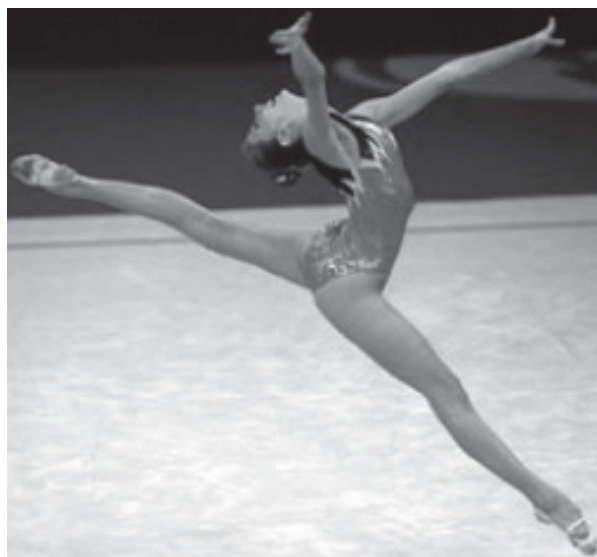
2007 оны Сиднейн Олимпийн үеэрх ритмт гимнастик

2005 оны 7 дугаар сарын 14-нд Хонгког дахь Хятадын Хамтын Харилцааны Албаны өмнөх талбайд цаазаар авах ялыг эсэргүүцэгчид жагсаж буй нь. Барьсан зурагт хуудас нь Хятадад цаазлагдсан Хонконгийн гэмт хэрэгтнүүд