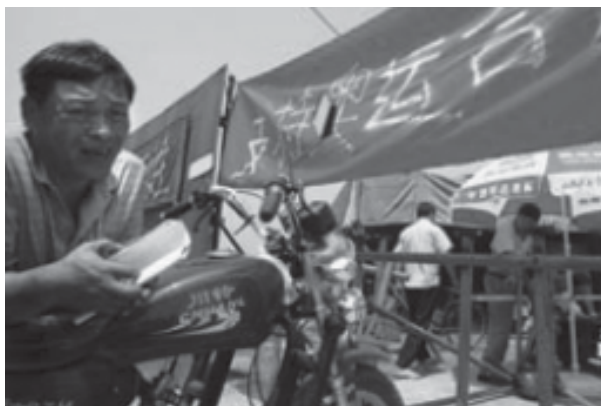
Жагсагчид 2008 оны Бээжингийн Олимпийн усан спортын барилга барихыг эсэргүүцэн нэгдэж буй нь: 2005 оны 6 дугаар сар

Албан бус мэдээгээр албадан нүүлгэлт улам бүр нэмэгдэгдэж байгаа бөгөөд олон улсын хүний эрхийн хэм хэмжээнд заасан орон байртай байх эрхийг зөрчиж байна. Албадан нүүлгэлтэнд өртсөн хүмүүсийн тоо яг