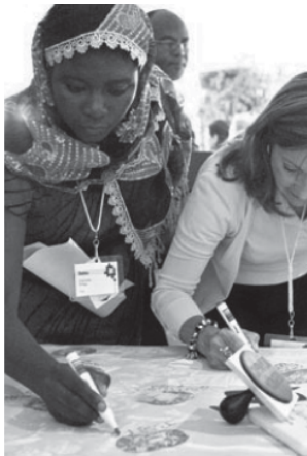
Эмнести Интернэшнлийн төлөөлөгчид Олон улсын зөвлөлийн хурлын үеэрээ Бээжингийн Олимпын кампанит ажлын нэгэн хэсэг болох тамга дарж, гарын үсэг зурах ажиллагаанд оролцож буй нь, 2007 оны 8 дугаар сар

Хятад улс нь цаазаар авах ялын гүйцэтгэлээрээ дэлхийд тэргүүлдэг бөгөөд бусад улс орнуудын цаазалснаас ч илүү олон хүний цаазладаг билээ. 2006 онд Хятадад 2790 хүнд цаазаар авах ял оносноос 1010 хүнийг цаазалсныг олон нийтийн мэдээллийн хэрэгсэлүүд тогтоогоод байна. Бодит тоо үүнээс хамаагүй өндөр