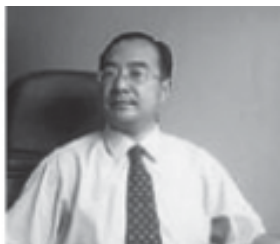
Ян Тонгуан (нууц нэр: Ян Тианшүи) чөлөөт зохиолч © Хятадын Бие даасан Зохиолчдын Төв

Зохиолч, сэтгүүлч Хуан Жинчюу Жиансү мужийн Нанжин хотын ойролцоох Пүкоу шоронд «хорлон сүйтгэх үйл ажиллагаа»-тай холбоотой хэргээр 12 жилийн ял эдэлж байгаа ба энэ нь түүний Хятадын Эх Оронч Ардчилсан Нам байгуулах төлөвлөгөө зэрэг улс төрийн сэдэвтэй зохиолоо интернэтэд цацсантай холбоотой ажээ. Өөр нэгэн чөлөөт зохиолч Ян Тонгуан мөн л Хятадад улс төрийн болоод ардчилсан өөрчлөлт явуулахыг дэмжсэн зохиол бичсэнийхээ төлөө « хорлон сүйтгэх үйл ажиллагаанд оролцсон» хэмээн буруутгагдаж 2006 оны 5 дугаар сард 12 жилийн ял авсан байна.