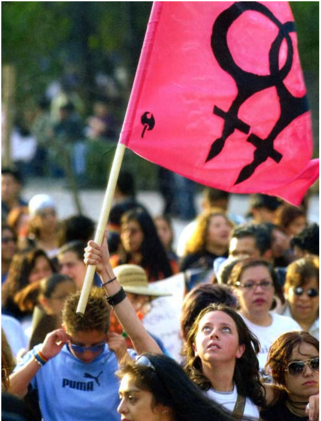
2003 оны 3-р сард мянга мянган эмэгтэйчүүд лесби нарын цуглаанд нэгдсэн байна. Дэлхий даяар эмэгтэйчүүд бэлгийн чиг хандлагын хувьд хараат байх явдал өргөнөөр тархаж багаатай холбоотойгоор эрхээ хамгаалан тэмцэж байгаа юм.