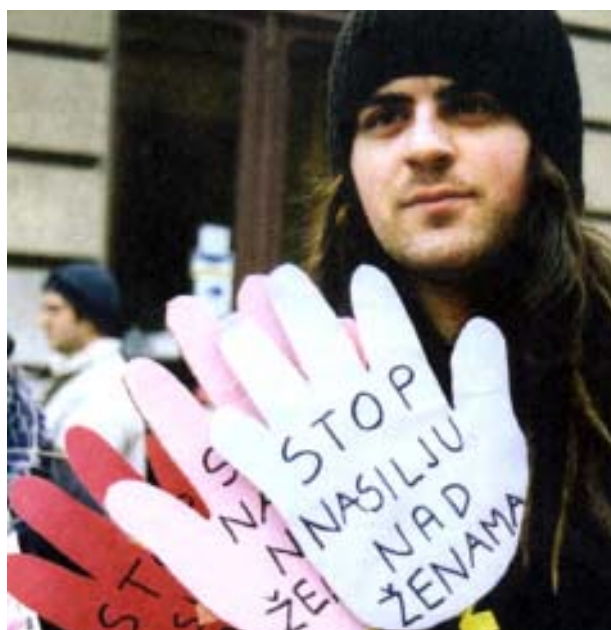
Загреб-д Хорватын ЭИ-ийн ЭЭХТЗ кампанит ажлын үеэр. 2004 оны 3-р сар

Нэмж тодорхойлоход, та дээрх бүлгүүдээс хэн нь эмэгтэйчүүдийн эсрэг хүчирхийллийг таслан зогсоохын эсрэг байх вэ гэдгийг тогтоох хэрэгтэй. Таны эсрэг ямар маргааныг ямар тактиктаар ашиглаж болох вэ гэдгийг та кампанит ажлынхаа нэг хэсэгт урьдчилан тооцоолж оруулах хэрэгтэй.