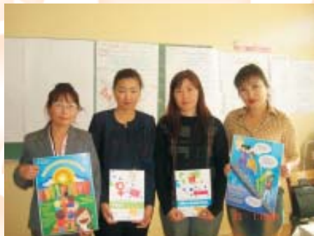
Сургалтын дараа. 2006 оны 10-р сар. Дархан-Уул аймаг