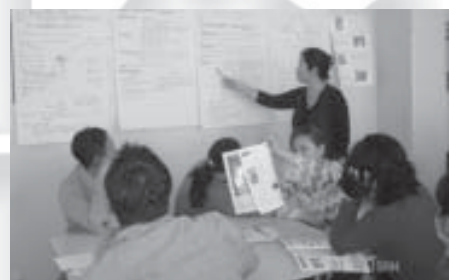
Математикийн багш нарын баг. Дархан-уул аймаг. 2006 оны 10 сар

Хүний эрхийн нөхцөл байдлыг тодорхойлоход математик үргэлж хэрэглэгдэж иржээ. Математик нь бидэнд эх дэлхийгээ илүү сайн ойлгоход тусалж ирсэн ба математикгүйгээр бид дэлхий дээр болж байгаа үйл явдлын чиг хандлагыг судалж шинжилж чадахгүй.