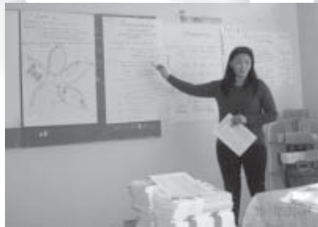
Бага боловсролд хүний эрхийг нэгтгэх нь. 2006 оны 10 сар. Дархан-уул аймаг.

Бага ангид сурагчдад хүний нэр төр, онцлог байдлыг хүндэтгэх хандлагыг багаас нь хөгжүүлэх нь хамгийн чухал гээд энэ хандлагыг төлөвшүүлэхийн тулд Бага ангийн багш нарын багууд "Эвтэй дөрвөн амьтан", "Долоон бор оготно", "Хөхөө", "Сандарсан тотийн худал хэлсэн нь" "Ухаант оготно" үлгэр зэрэг сэдвийг сонгон хүний эрхийн ойлголттой нэгтгэн заах хичээлийн төлөвлөлт хийж байсан нь хүн бүрийн сонирхлыг татаж байлаа.