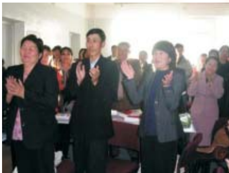
Сургалтанд оролцогчид сургагч багш нартаа талархаж байгаа нь.

Мөн 2007 оны 4 сард БСШУЯ-аас зохион байгуулах сурах бичиг зохиогчдоод зориулсан сургалтанд сургагч багшаар ажиллах саналыг хүлээж аваад байна.