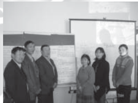
Репиний амьдрал уран бүтээлийг судлах явцдаа хүний эрхийг ойлгуулах нь. Говьсүмбэр аймгийн дүрслэх урлагийн багш нарын баг.