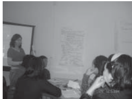
«Ус» сэдвээр хүний эрхийг нэгтгэж заах нь. Байгалийн ухааны багш нарын баг. Улаанбаатар хот. 2007 оны 1 сар.

Ийнхүү тодорхой сэдвээр хүний эрхийг нэгтгэж заах тухай бүлгээр ажилласны эцэст ЕБС-ийн бүхий л хичээлүүдээр хүний эрхийн тухай ойлголтыг нэгтгэж заах маш өргөн боломж байгааг илүү сайн ойлгож мэдэрснээ сургалтанд оролцогч бүр дүгнэж байлаа.