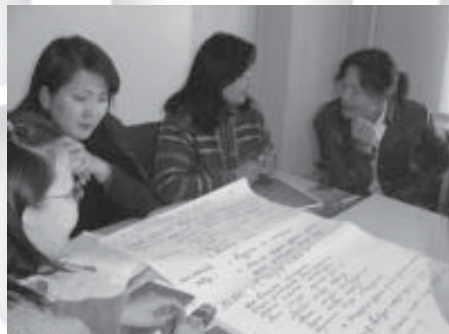
Монгол ардын дуу «Сэндэр охин» дугуу сонгон хөгжмийн хичээлийг хүний эрхтэй нэгтгэж заах нь сэдвээр ажиллаж байгаа нь. Орхон аймаг. 2006 оны 9 сар.