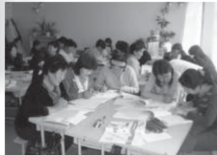
2006 оны 10 сар. Багануур.