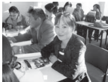
Сургалтын дараах мөч. Орхон аймаг.