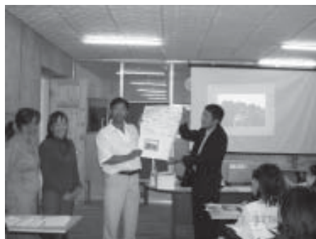
Хүүхдийн эрхийн сургалтын хэсэг. Завхан аймаг. 2006 оны 8 сар.