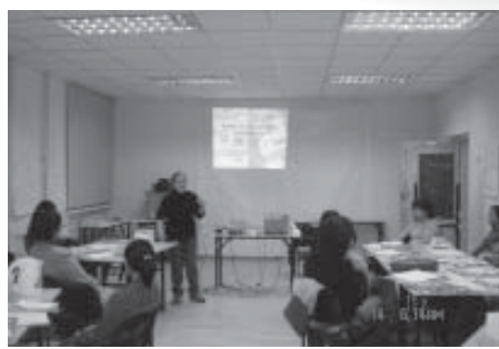
Д.Оюунномин багшийн харилцааны тухай хичээл нь сургалтанд оролцогчдын сонирхол татсан нэг хэсэг байсан юм.

Сургалтанд оролцогчдын дунд явуулсан хүний эрхийн хөгжөөнт тоглоомын азтанг шалгаруулж байгууллагын лого бүхий футволкоор урамшуулж байсан нь сургалтыг улам бүр сонирхолтой болгосон юм.