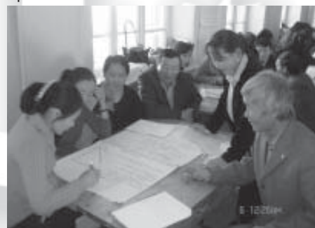
Математикийн багш нарын баг. Говьсүмбэр аймаг. 2006 оны 11 сар