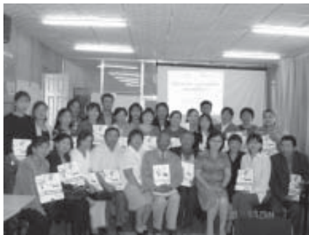
Завхан аймагт хийсэн эхний сургалтын сүмдүүдэн сургуулийн захирал, сургалтын менежерүүд хамрагдлаа.

Сургалтын явцад багш нар Хүний эрхийн Түгээмэл тунхаглал, Монгол Улсын Үндсэн Хууль болон бусад эрх зүйн баримт бичгүүдтэй ажиллаж, ЭНСЭ, Цэвэр усаар хангагдах эрх, Хүүхдийн эрхийн Конвенц зэрэг олон улсын баримт бичгүүдтэй танилцан бүлгээр ажиллалаа.