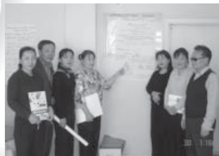
Монгол хэл, уран зохиолын багш нарын баг. Дархан-уул аймаг. 2006 оны 10 сар.