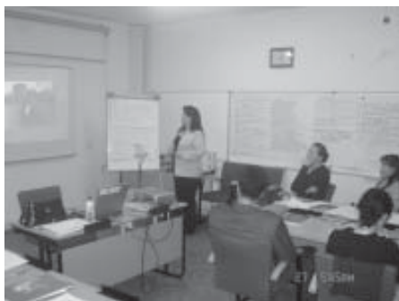
Хүүхдийн эрхийн сургалтын хэсэг. Улаанбаатар хот.

Усны тухай “2070 онд бичсэн захидал” видео материалыг үзүүлэв.