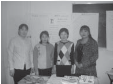
Хөгжмийн хичээлийг «Цаасан шувуу» дугаар хүний эрхтэй холбож заах нь сэдвээр ажилласан Олоннэмэх ахлагчтай баг. Улаанбаатар хот

4-р сургуулийн хөгжмийн багш Олоннэмэх ахлагчтай баг хөгжмийн хичээлээр хүний эрхийг хэрхэн нэгтгэж зааж болохыг болон хичээл хоорондын интеграцыг хэрхэн хийж болохыг "Цаасан шувуу" дууны утга санаагаар гаргаж ирсэн нь үнэхээр үлгэр жишээ сайхан ажил боллоо.