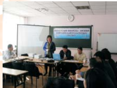
Сургалтын дараа. 2006 оны 10-р сар. Дархан-Уул аймаг