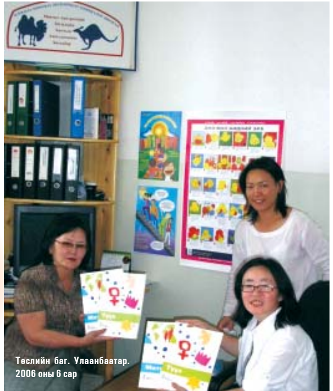
Төслийн баг. Улаанбаатар. 2006 оны 6 сар

Төслийн хүрээнд Эмнести Интернэшнлийн Английн секцээс гаргасан “Хүний Эрх Сургалтын Хөтөлбөрт” цувралын “Математик” ба “Түүх” номыг англи хэлнээс орчуулан тус бүр 1000ш, ХЭБ-ын 2 ширхэг зурагт плакатыг тус бүр 1000ш, ХЭТТ-ын хялбаршуулсан плакат 500ш-ийг сургалтын гарын авлага болгон хэвлүүллээ.