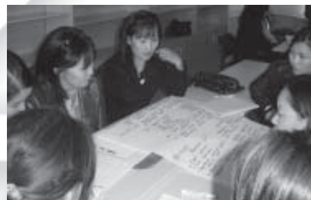
«Хөрөнгө хураалт» сэдвээр ажиллаж байгаа нь. Орхон аймаг. 2006 оны 9 сар.

Түүх бол хүний эрхийн хөгжил хувьслыг заах үндэс тулгуур бөгөөд үе үеийнхний хүний эрхийн төлөөх тэмцэл, хөдөлгөөн болон хүний эрхийн тунхаглалын зарчим, хэм хэмжээ, конвенц протоколуудыг түүхийн хичээлээр заах бүрэн боломжтойг түүхийн багш нар болон арга зүйчид бүлгээр ажиллаж харууллаа. Хүний эрх түүний зөрчигдөх явдалтай холбоотой үйл явдлуудыг орчин үеийн дэлхийн түүх, дэлхийн I, II дайны түүхээр дамжуулан судлах өргөн боломжтой юм. Мөн аж үйлдвэрийн хувьсгал нийгмийн бусад хөдөлгөөнүүдийн түүхийг эдийн засаг, нийгэм, соёлын эрхүүдтэй холбож тоймлон үзэж болно. “Дэлхийн II дайн”, “Манжийн дарлал дахь Монгол орон” “Хөрөнгө хураалт”, “Улс төрийн хэлмэгдүүлэлт”, “1990 оны ардчилсан хувьсгал” зэрэг сэдвүүдээр түүх, нийгмийн ухааны хичээлийг хүний эрхтэй нэгтгэж заах маш өргөн боломж байгааг тэд бүлгээр ажиллан гаргаж ирлээ.