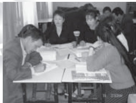
Завхан аймгийн бага боловсролын сургалтын менежерүүдийн баг. 2006 оны 8 сар.

• Танхимаар болон танхимын бус хэлбэрээр байна гэж гаргаж ирсэн нь тэдэнд практик ач холбогдолтой боллоо.